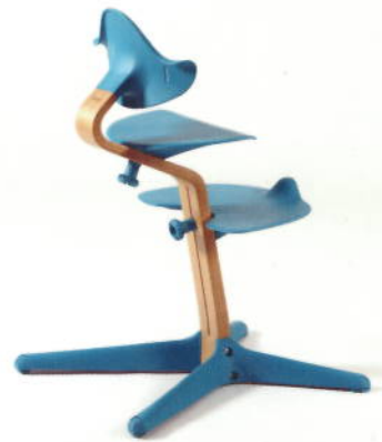
Midtstamme og åpne sider gir enkel opp- og nedstigning.