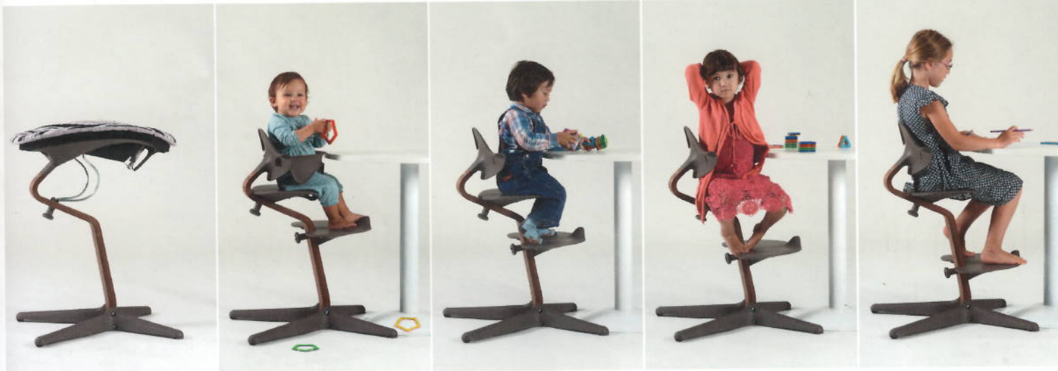
Nomi fra nyfødt til tenåring.